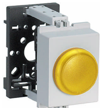
SL LED-YE VE21 xxx V 35x45 mm