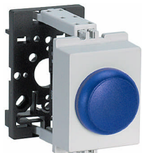
SL LED-BL VE21 xxx V 35x45 mm