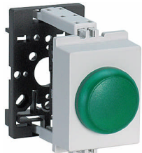
SL LED-GN VE21 xxx V 35x45 mm