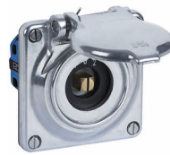
GV.S.09 83x98 mm