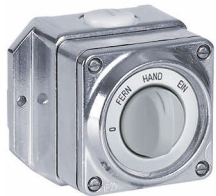
AGB.09 83x98 mm