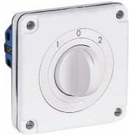
NUP.61 87x87 mm