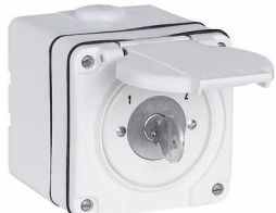
NAP.SS.61 87x87 mm