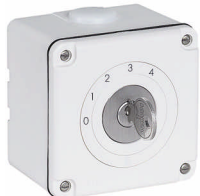
NAPU.SS.61 87x87 mm